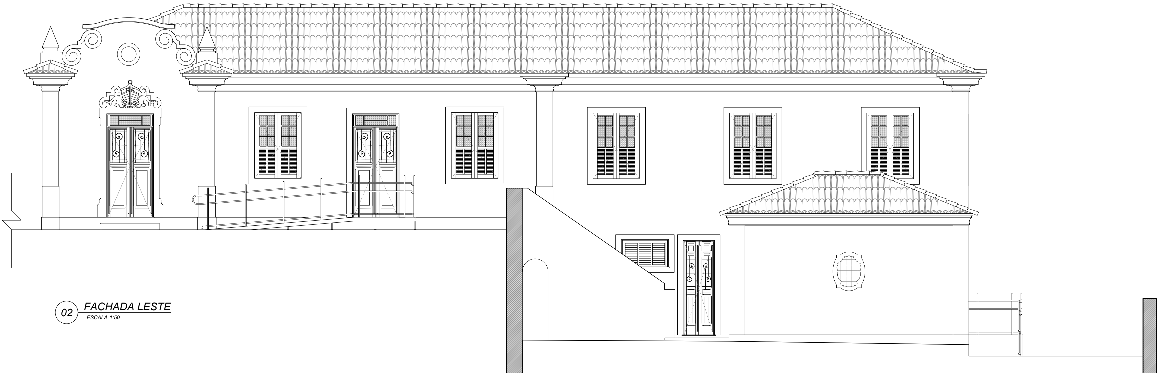
02 FACHADA LESTE ESCALA 1:50