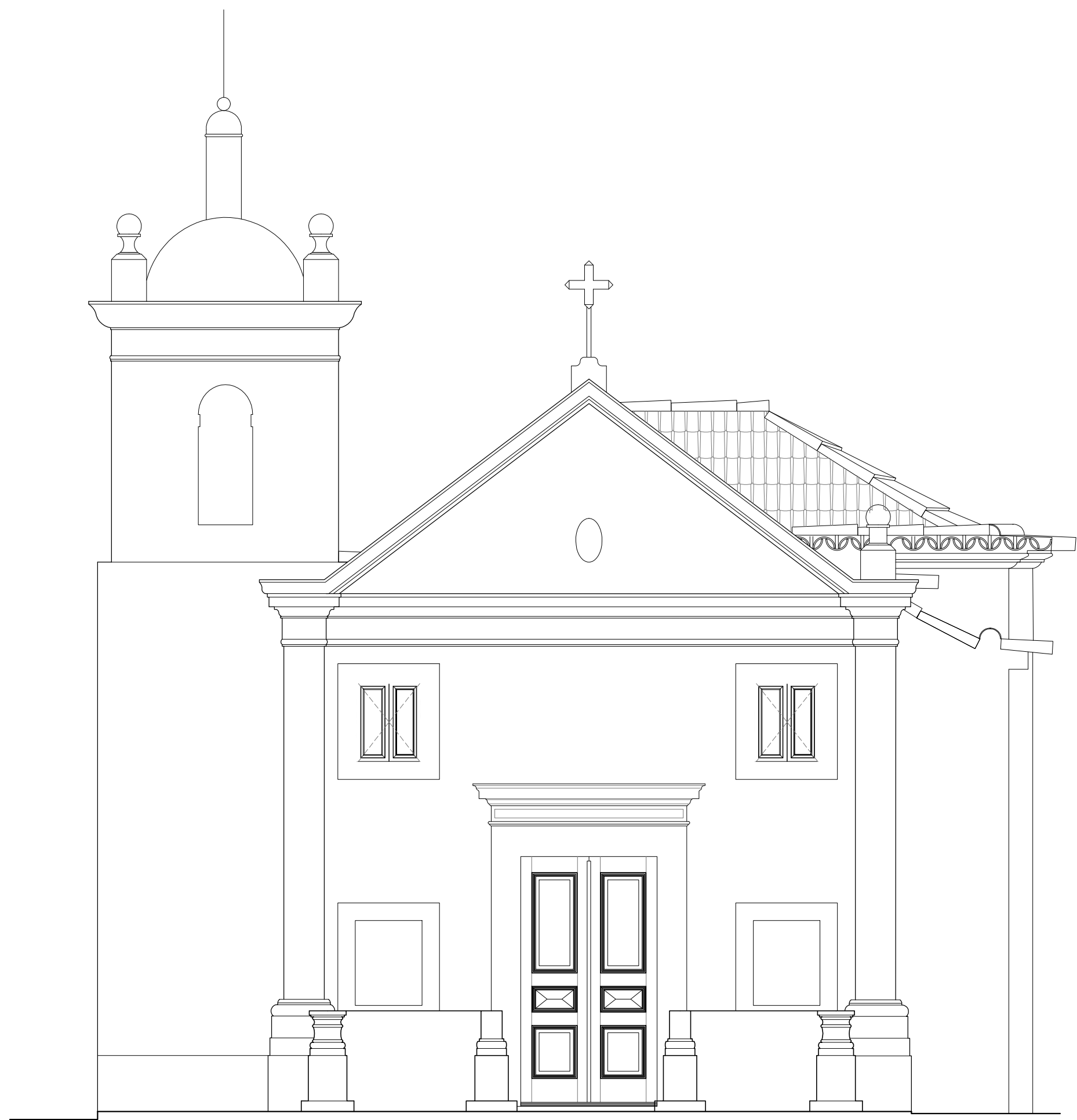
01 FACHADA SUL ESCALA 1:50