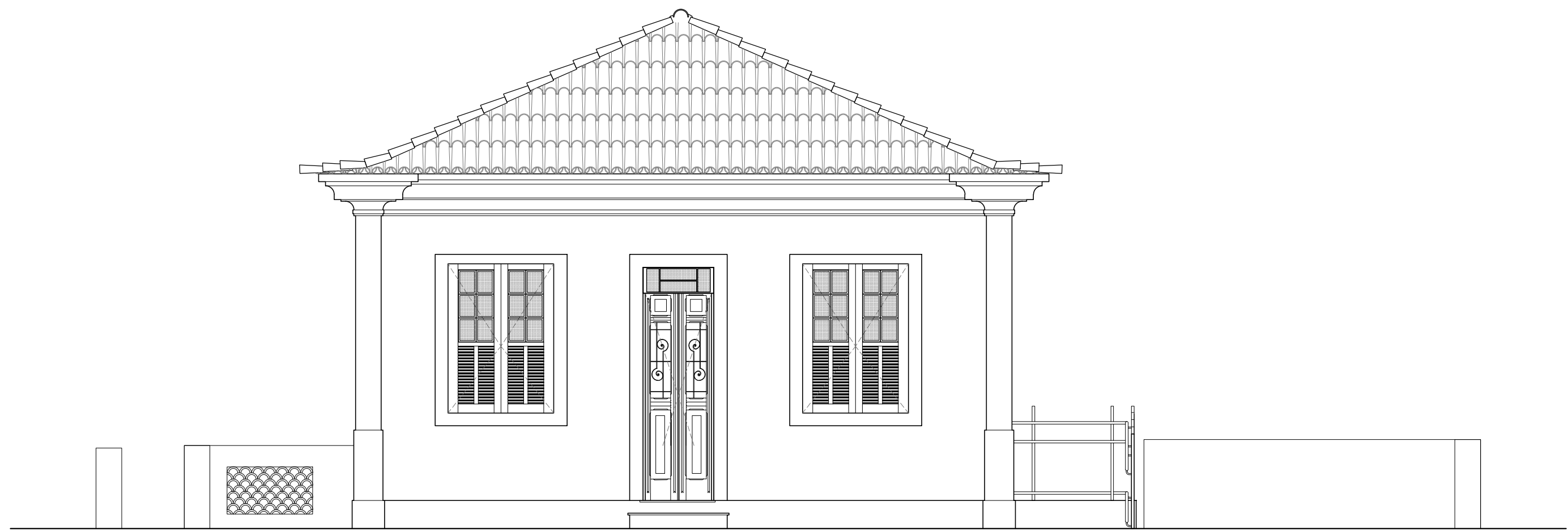
01 FACHADA SUL ESCALA 1:50