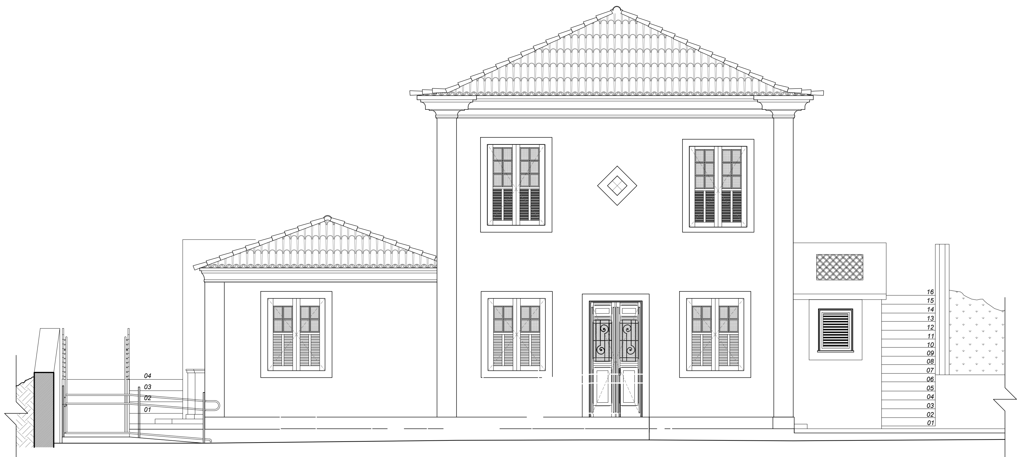
03 FACHADA NORTE ESCALA 1:50