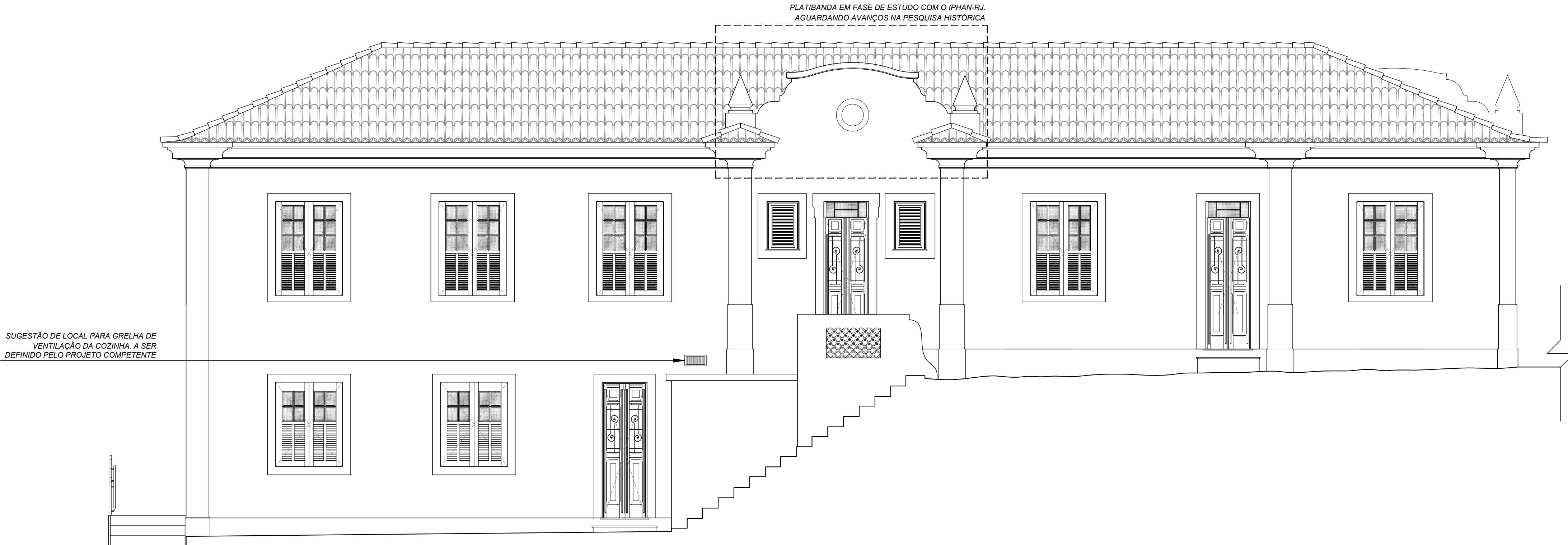
04 FACHADA OESTE ESCALA 1:50