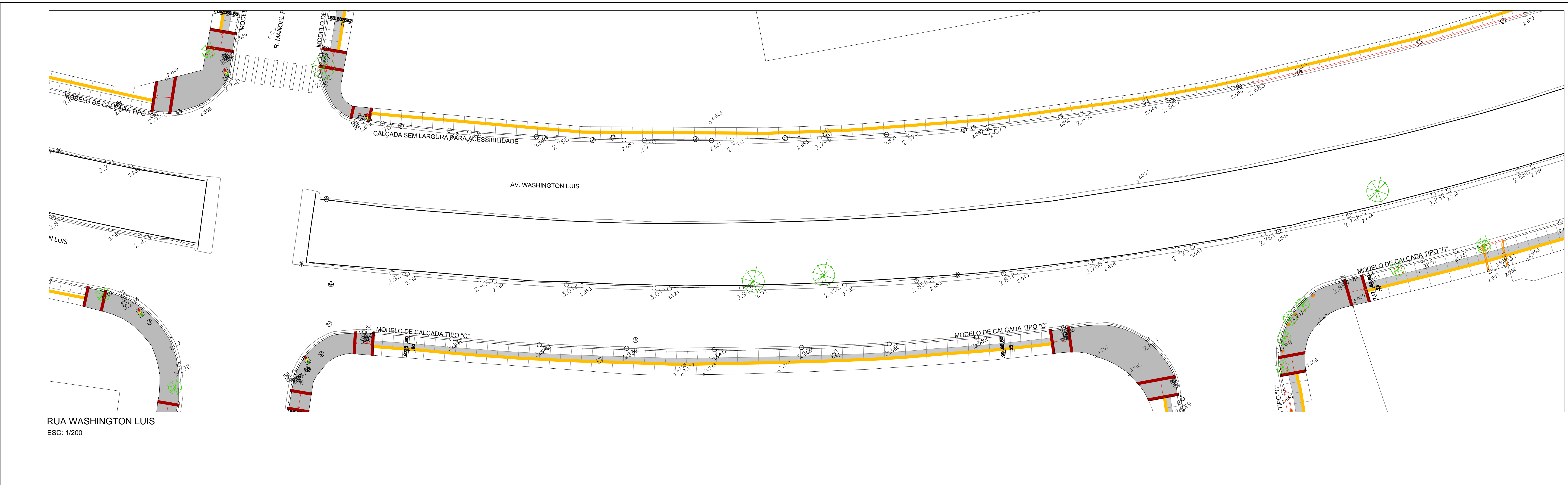
RUA WASHINGTON LUIS ESC: 1/200