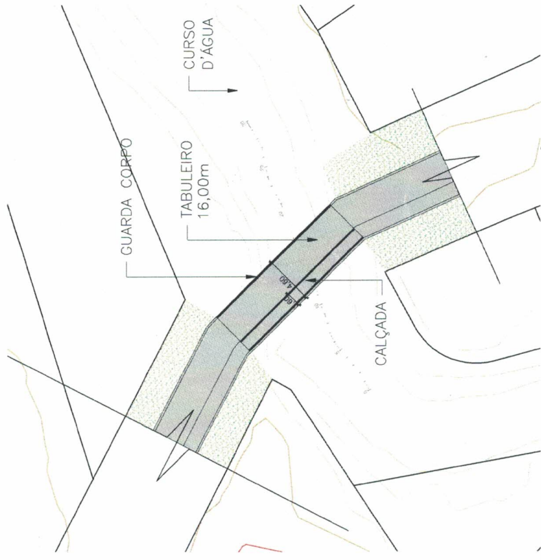
1 IMPLANTAÇÃO ESCALA 1:500