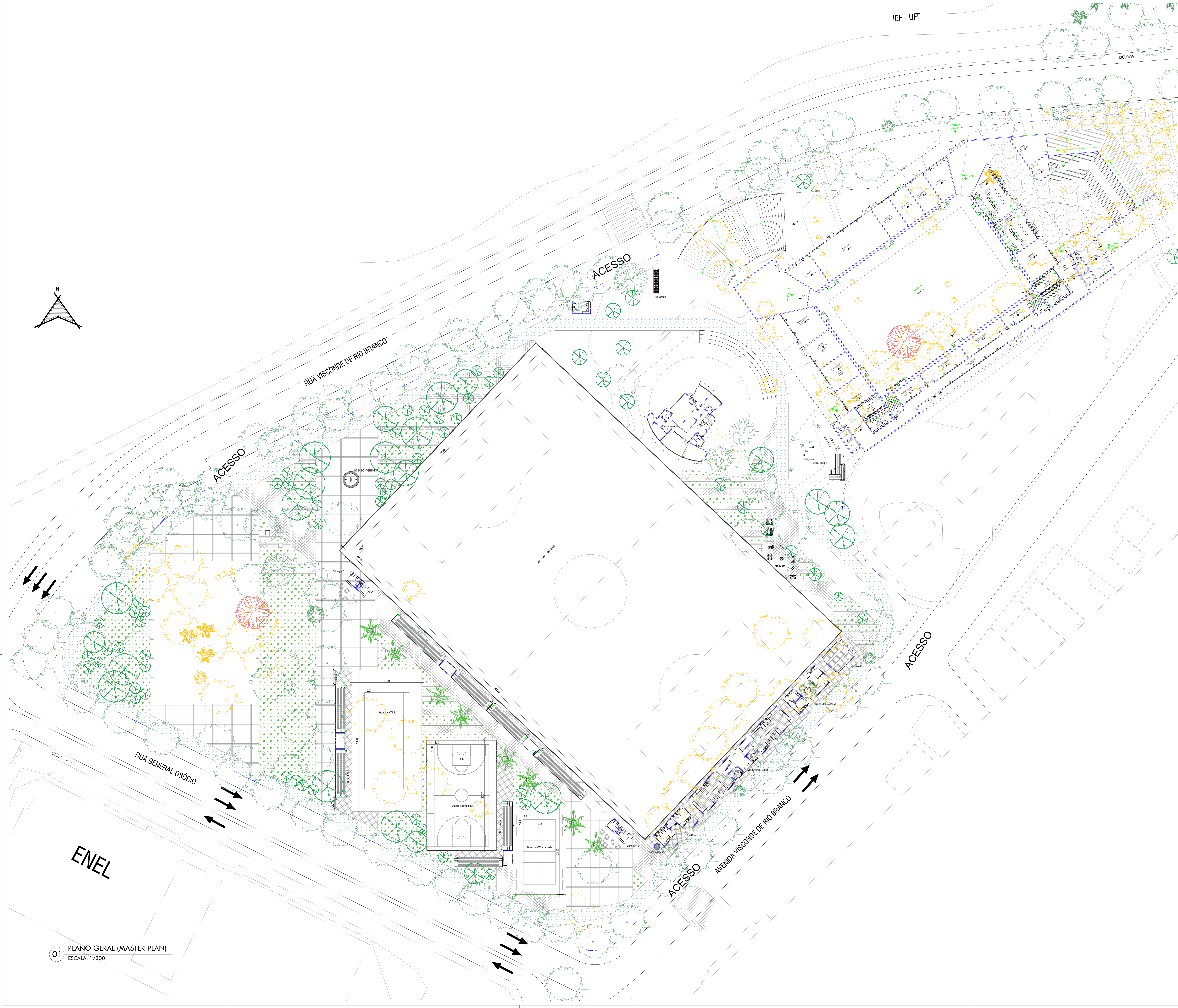
01 PLANO GERAL (MASTER PLAN) ESCALA: 1/300