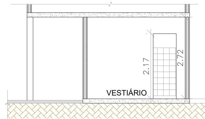
Corte BB' - Esc. 1/75