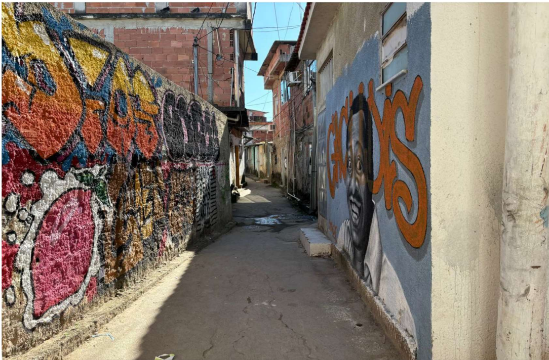
5.1.3 – Figura 03: Foto do local de intervenção.