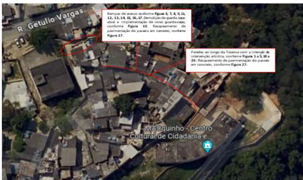
5.1.1 – Figura 01: Localização da Intervenção (endereço do Google Maps).