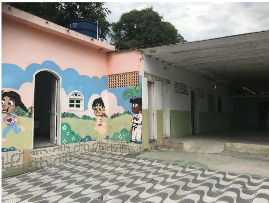
Figura 2 – Pátio com piso danificado, rampas não adequadas.