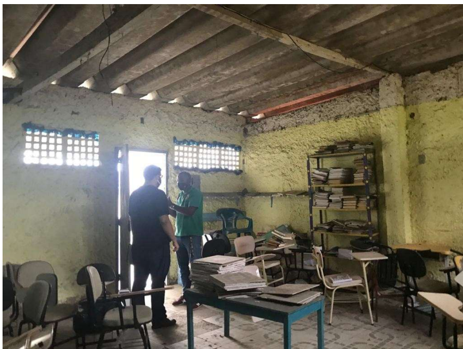
Figura 10 – Sala de multiuso (telhado precário)