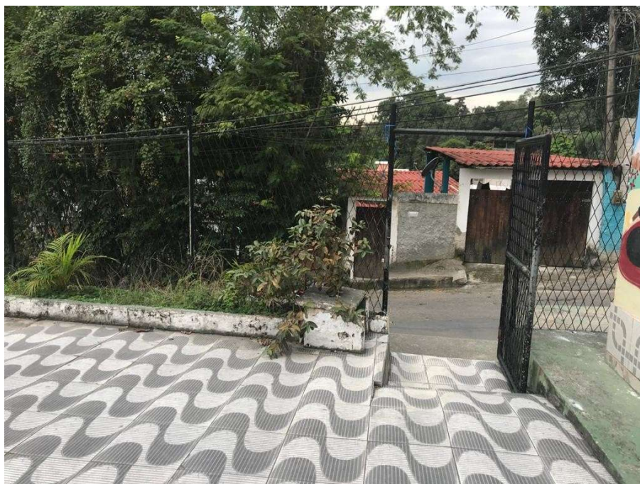
Figura 03: Pátio e acesso do Centro Comunitário.