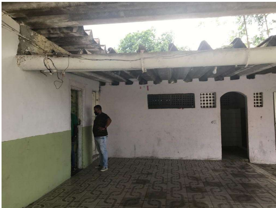
Figura 9 – Telhado da área comum