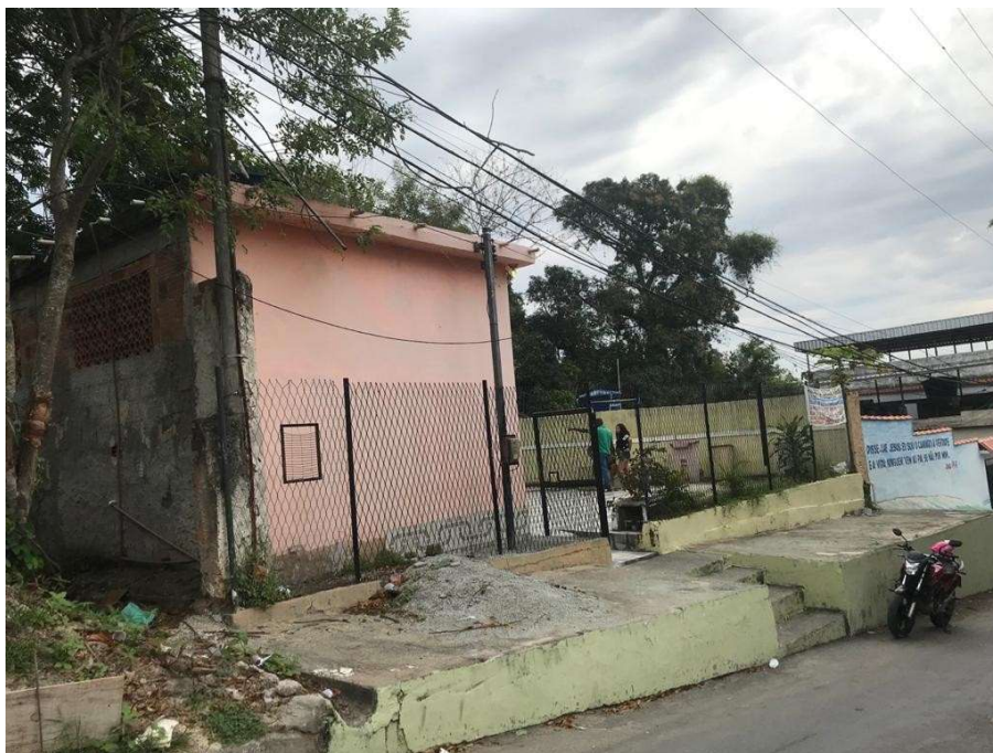
Figura 1 – Entrada pela Rua Conceição da Silva Barros, Sapê (Sem acessibilidade adequada ao local)