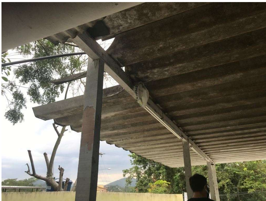
Figuras 11 e 12 - Telhas quebradas e comprometidas, gerando infiltração