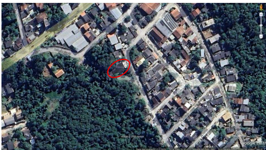
Figura 1 - Google Earth - Georreferenciamento (Zone 23 K, Longitude: 699162.00 m E e Latitude: 7466490.00 m S)

O objetivo dessa visita técnica é atender demanda de moradores em local solicitado através de análise técnica para atestar as condições do local e a viabilidade da “Reforma de Centro Comunitário no Bairro Sapê, Niterói - RJ”.