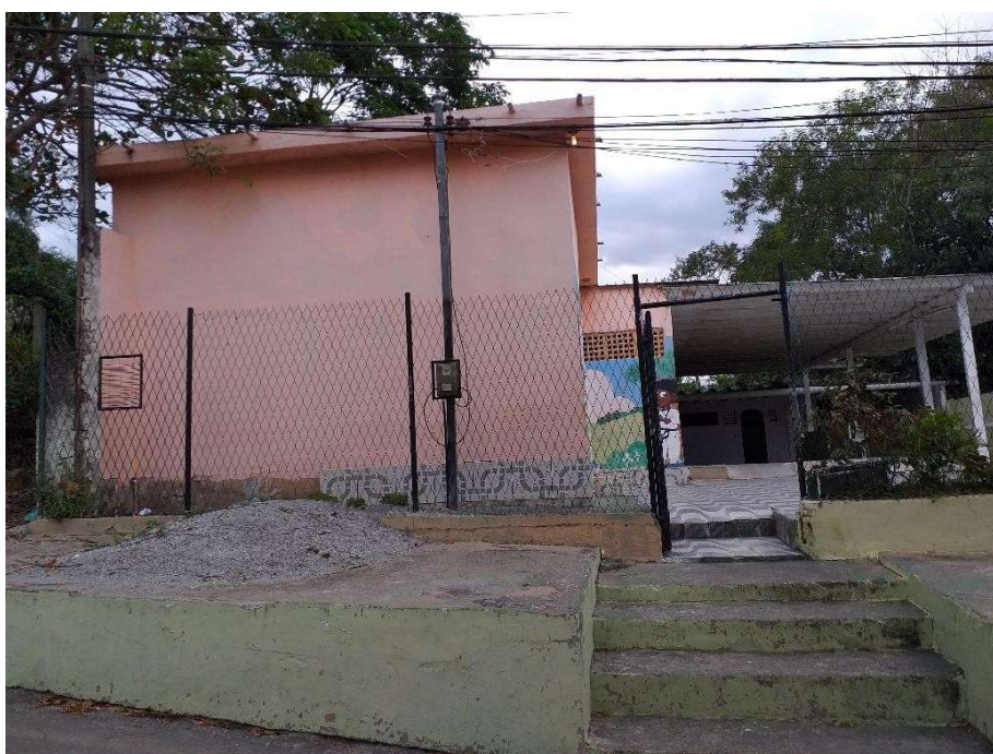
Figura 03: Foto frontal do local de intervenção.