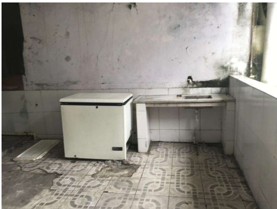
Figura 13 – Área de Churrasco danificada