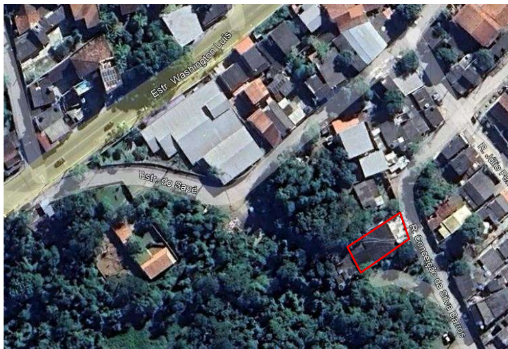
Figura 02: Área de intervenção.