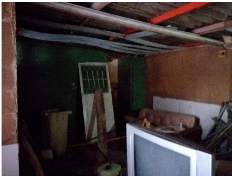
Figura 04: Fundos do Centro Comunitário e material sem devido local de armazenamento.