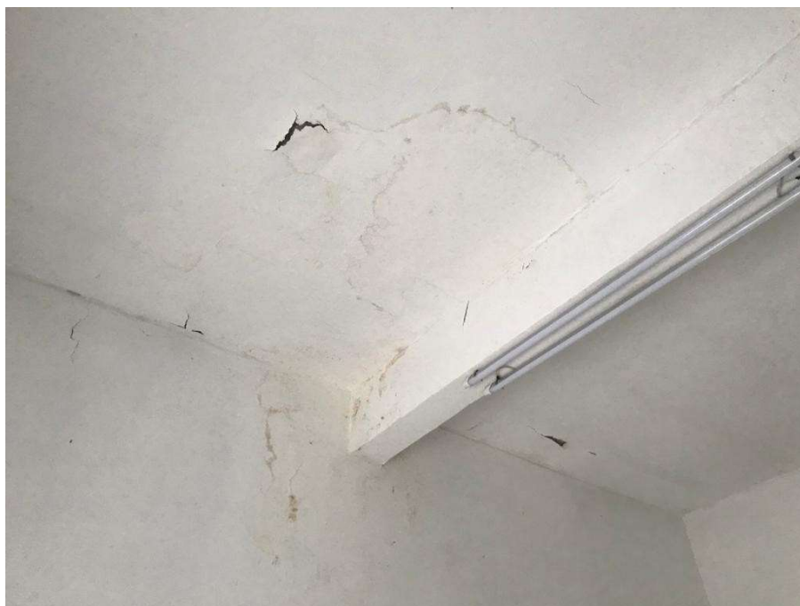
Figuras 3, 4 e 5 – Pontos de infiltração da laje na sala de inundação