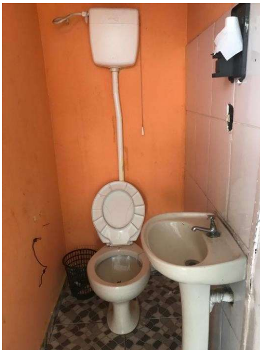
Figura 6 – Banheiro social danificado, sem papeleiras