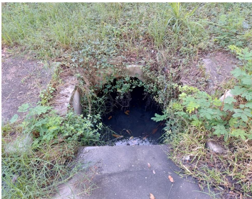
Figura 3 - Sistema de Drenagem precário