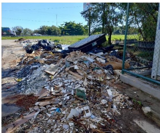
Figura 02: Rua Padre Marcelino.