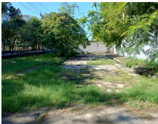
Figura 03: Rua em estado precário.