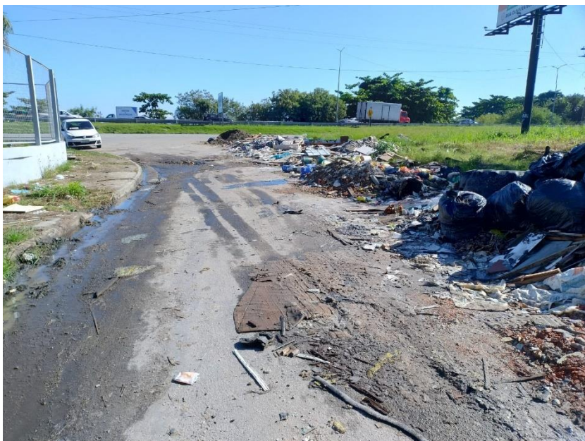
Figura 2 - Estrutura do cais precária