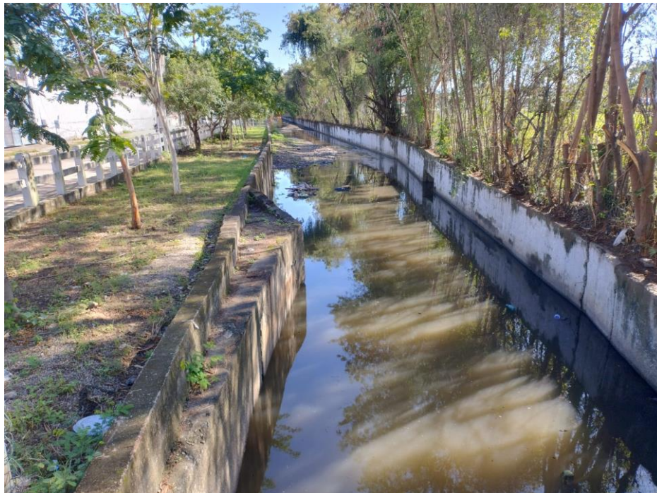
Figura 5 - Drenagem, Pavimentação e Infraestrutura precária