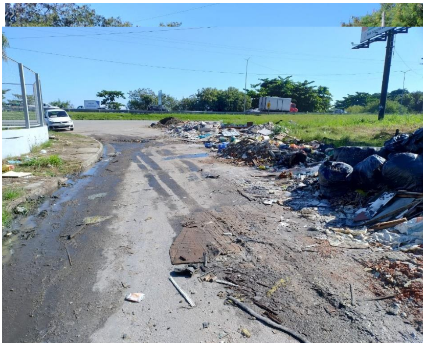
Figura 1 - Infraestrutura precária