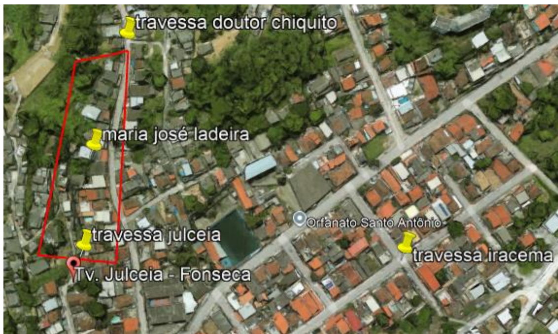
Figura 1 - Google Earth – Georreferenciamento Travessa Dr. Chiquito (Zone 23 K, Longitude: 696721.99 m E e Latitude: 7469060.04 m S)

Georreferenciamento Travessa Julceia (Zone 23 K, Longitude: 696684.15 m E e Latitude: 7468895.61 m S)