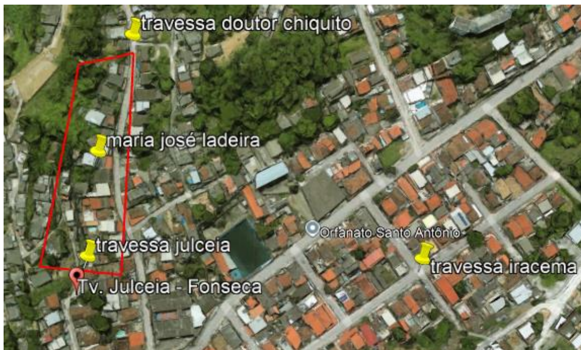
Figura 01: Área de intervenção.