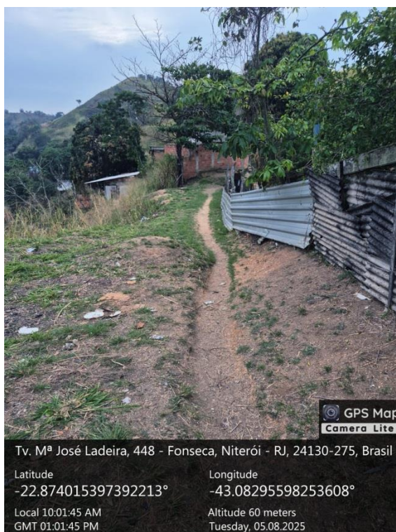
Figura 02: Foto do local de intervenção