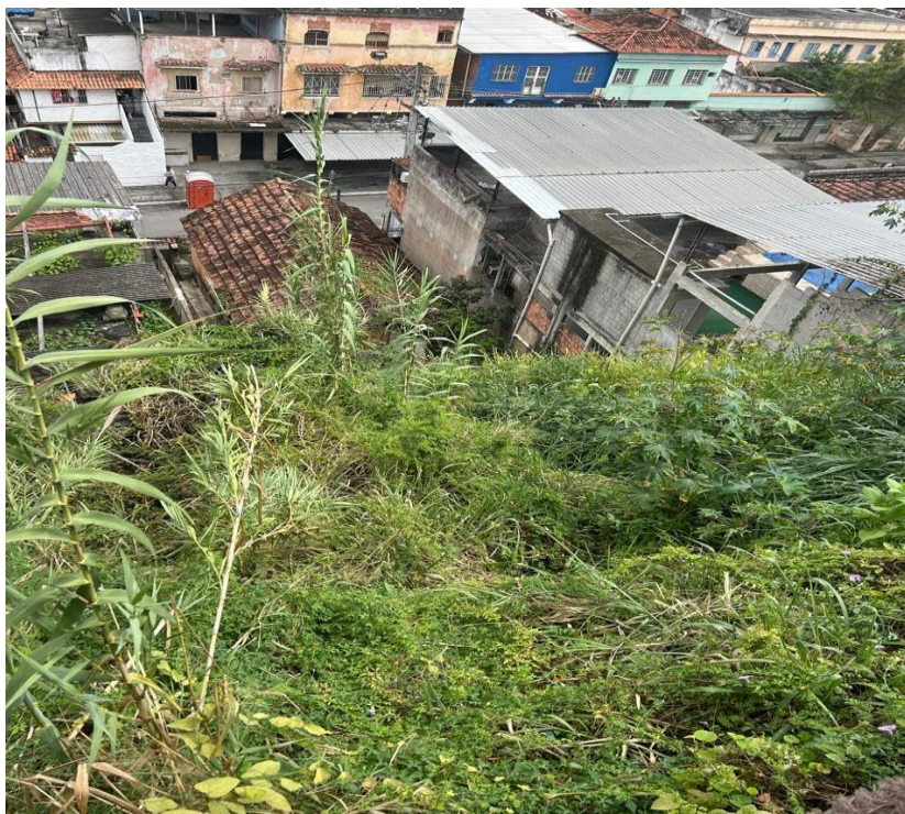
Figura 02: Foto do local de intervenção