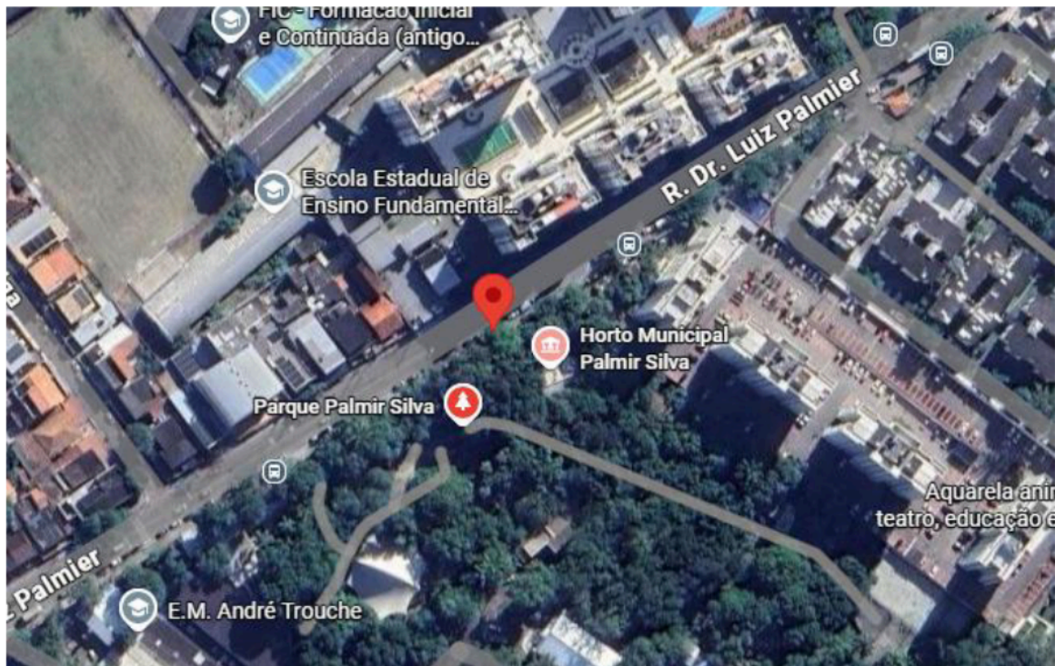
Figura 01: Localização da intervenção: ( https://www.google.com/maps/place/Telecentro+Professor+Firmino+Marisco+Filho/ ).