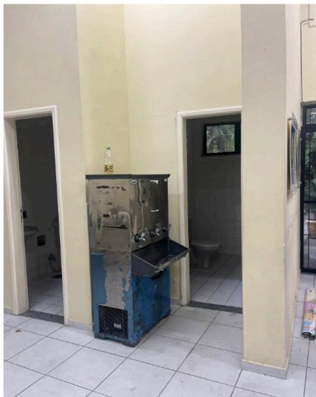
Figura 5: Necessária manutenção e instalação em tomadas, pontos elétricos e luminárias