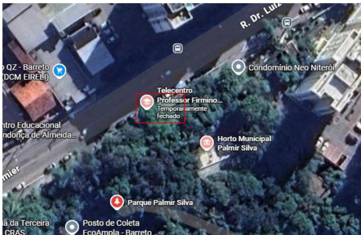
Figura 02: Área de intervenção.