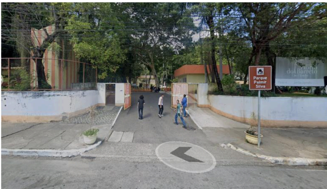
Figura 1: Rua Dr Luiz Palmier, 235 – Barreto, Niterói /RJ