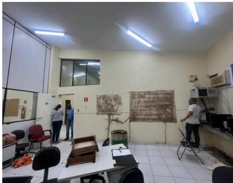
Figura 4: Necessidade de pintura interna e externa